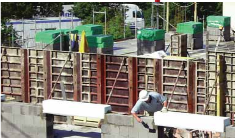
Neben der Grundsatzentscheidung für Neubau oder „Immobilie aus zweiter Hand“ ist die Wahl der Baumaterialien eine wichtige Frage.

Diese guten Rahmenbedingungen könnten ein wesentlicher Grund dafür sein, dass rund drei Viertel der Deutschen aktuell großes oder sehr großes Interesse an Bau Themen haben und sich intensiv mit der Frage beschäftigen, ob der Bau eines Eigenheims oder der Erwerb einer Bestandsimmobilie sinnvoll sein könnte. Um den Traum vom Eigenheim Wirklichkeit werden zu lassen, sind viele einzelne Schritte und Entscheidungen nötig, gute Vorbereitung ist überaus wichtig. Neben dem Kauf eines Grundstückes und