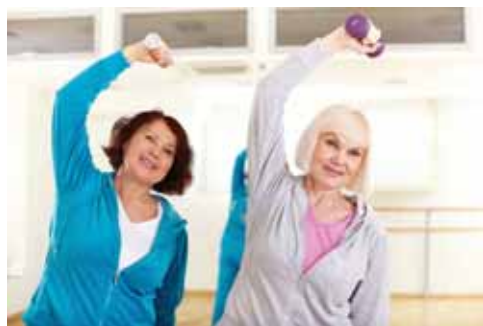
Längst erwiesen: Passivität im Alter schadet den Gelenken.