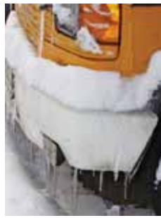
Blitzeis oder Schnee können zu chaotischen Verhältnissen führen.

und einige Kekse sind in diesem Fall als Notproviant sinnvoll, gerade wenn Kinder mit an Bord sind. Eine warme Wolldecke und Handschuhe sind ebenfalls hilfreich, falls der Verkehr einmal über mehrere Stunden zum Stehen kommt. Damit man bei unfreiwilligen Pausen auf der Autobahn nicht „trocken laufe“, sollte man zudem frühzeitig nachtanken.