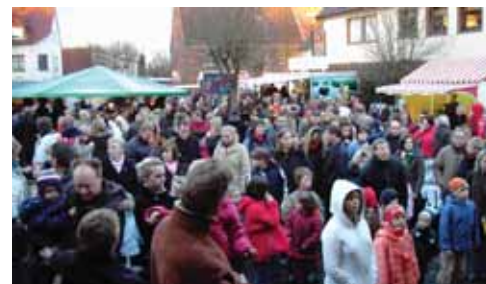
So sah es in den vergangenen Jahren zum Verkaufsoffenen Sonntag zur Adventszeit in Lippborg aus.

tro-Kleingeräte für die Körperpflege, für Küche und Haushalt natürlich die Bereiche Badboutique und Weihnachtsbäckerei umfasst. Eingebunden in das sonnätliche Geschehen sind auch die anderen Einzelhändler aus Lippborg, die gern auch für Beratungen bereitstehen.